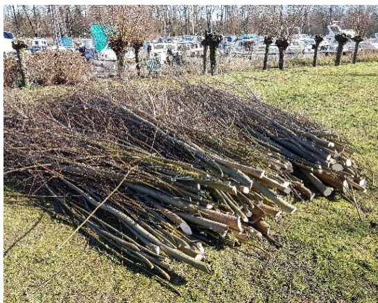
De jaarlijkse snoei van de knotwilgen