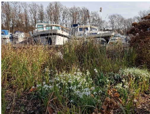
Sneeuwkllokjes op de dijk (16 februari 2019)