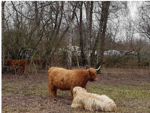
'Onze' Schotse hooglanders (13 februari 2019)