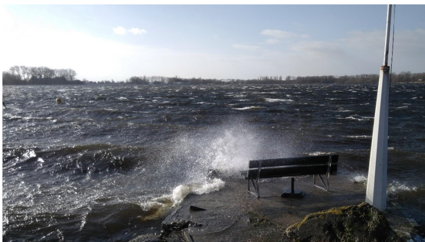
Storm over de Nieuwe Meer en Onklaar Anker (9 februari 2019)